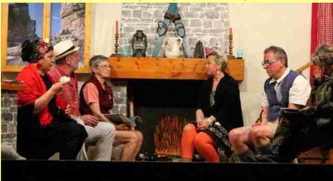
Les Exquis Mots d'Adé présentent la pièce «Les Marmottes», de Brigitte Barbe.

La Barthe-de-Neste (65) : article de presse paru sur La Dépêche du Midi (23/03)